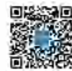
思壮北斗官方微信